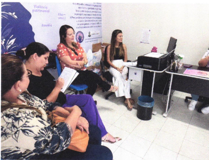
Reunião com equipe de técnicas da SEMEB para adesão ao projeto Quem Ama Cuida com Amor para ser desenvolvido nas escolas pela PEM.