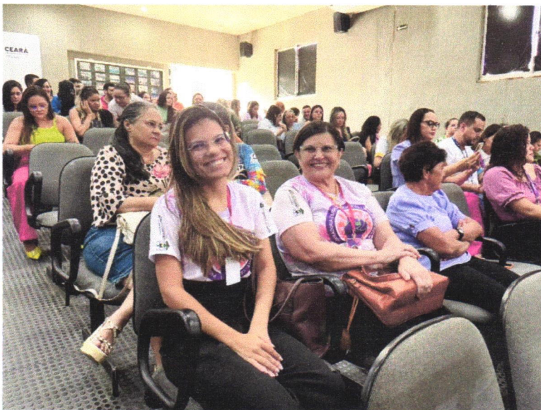
I Fórum sobre Autismo.