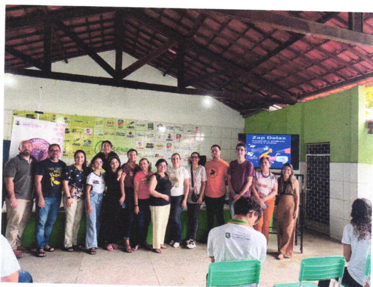
Palestra com o tema crimes cibernéticos na EEMTI Arsênio Ferreira Maia.