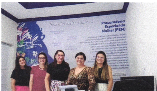
Reunião com a coordenação do Projeto Florescer