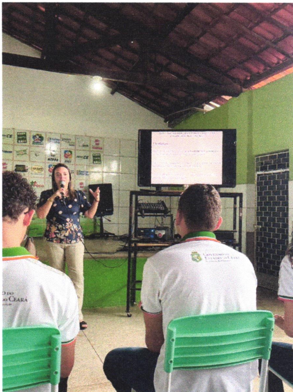
Palestra com o tema crimes cibernéticos na EEMTI Arsênio Ferreira Maia.