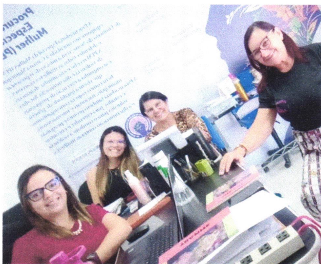
Reunião com a coordenação do Projeto Florescer