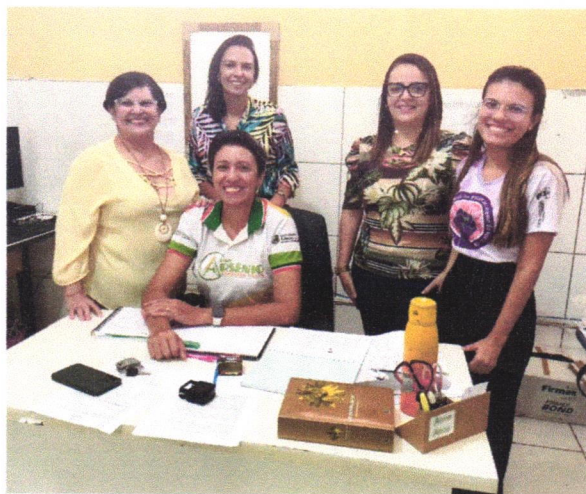
Apresentação dos projetos executados pela PEM à EEMTI Arsênio Ferreira Maia