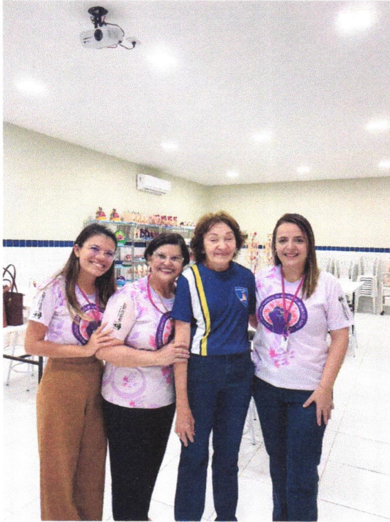
Visita para apresentação dos projetos executados pela PEM – Escola Normal Rural de Limoeiro do Norte.