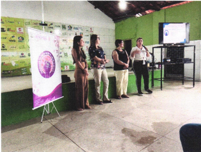
Palestra com o tema crimes cibernéticos na EEMTI Arsênio Ferreira Maia.