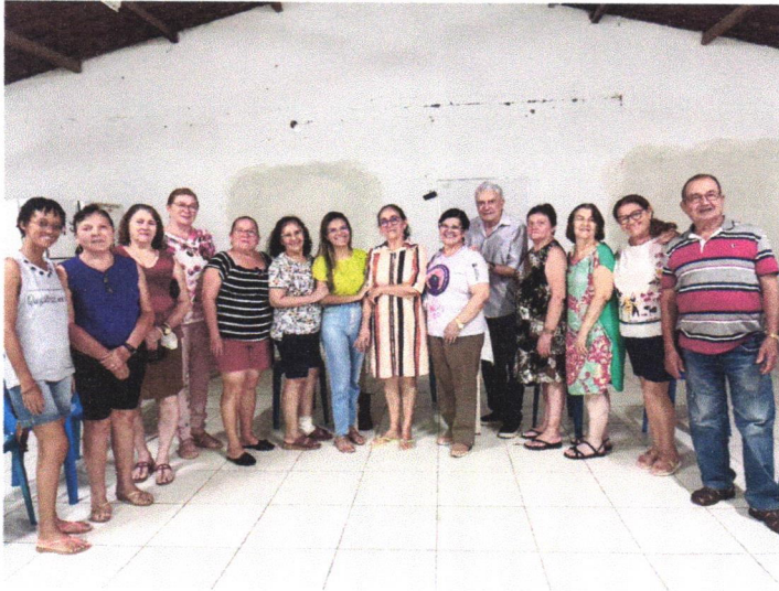
Reunião com os associados do bairro Santa Luzia para apresentação da PEM.