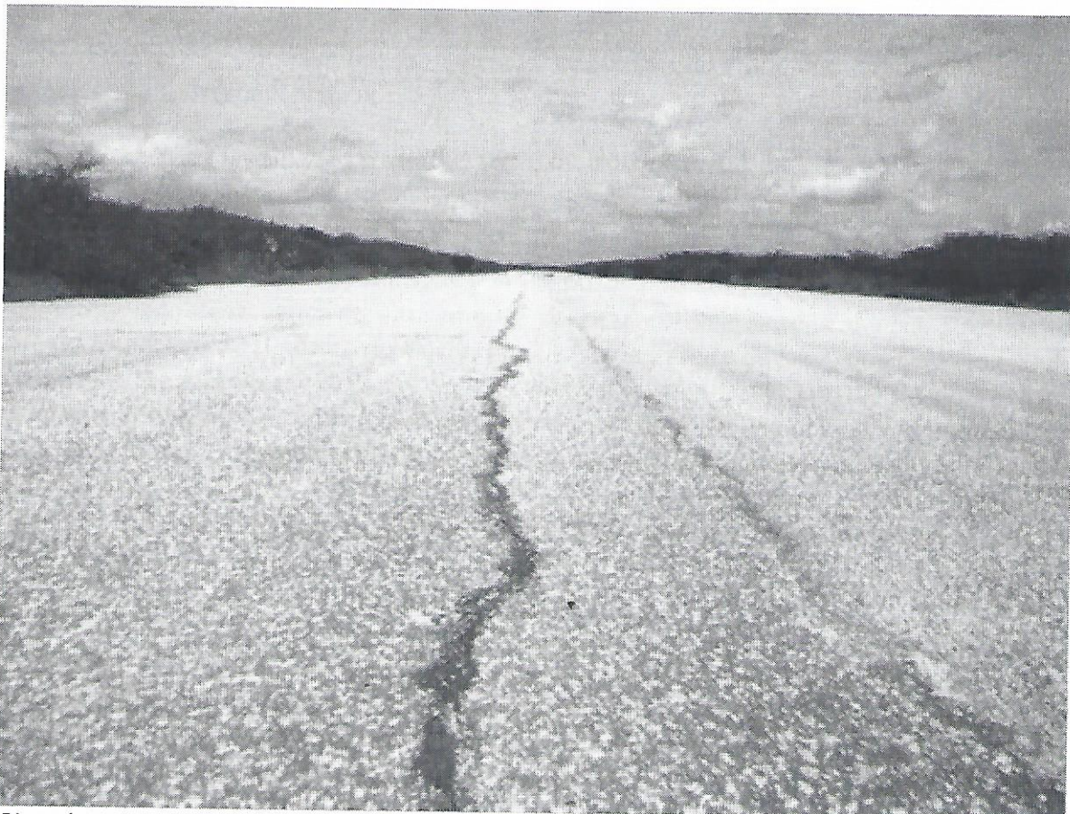
Pista do Aeroporto Regional de Limoeiro do Norte